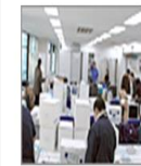
引越し、買取り、廃棄