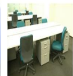
ワークステーション